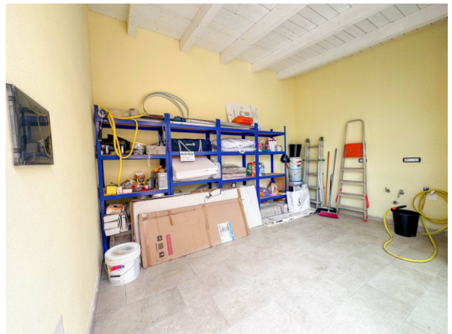
PIANO TERRA H. 2.70